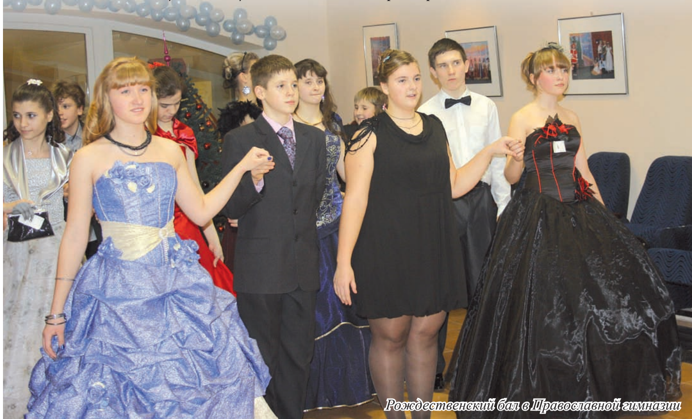
Рождественский бал в Православной гимназии