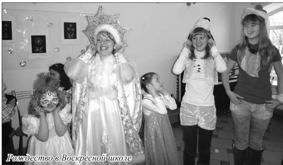
Рождество в Воскресной школе