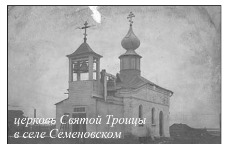
церковь Святой Троицы в селе Семеновском