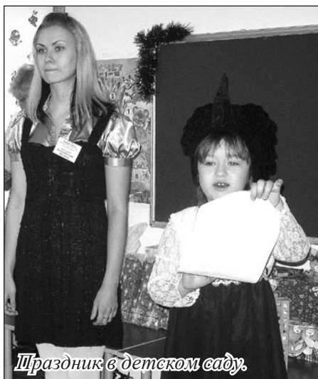
Праздник в детском саду.