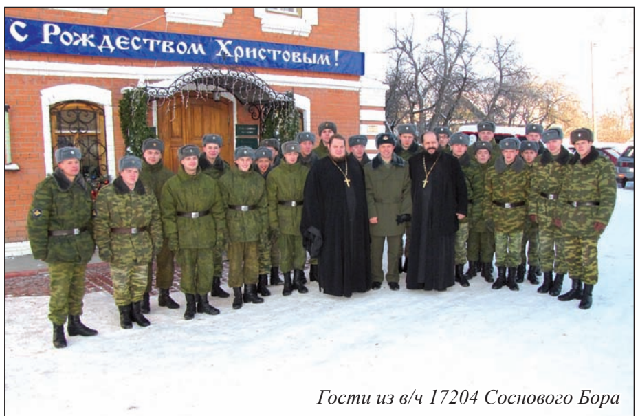
Гости из в/ч 17204 Соснового Бора