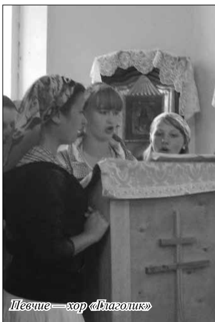
Певчие — хор «Глаголик»