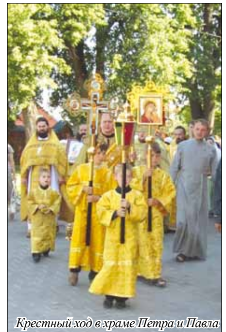
Крестный ход в храме Петра и Павла