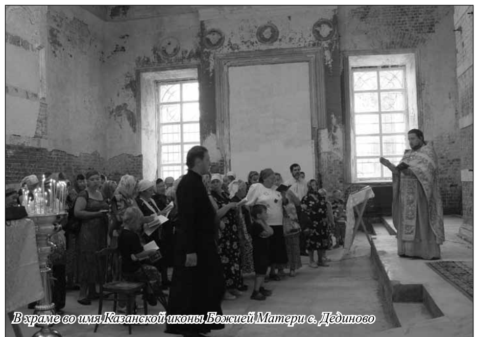
В храме во имя Казанской иконы Божией Матери с. Дединово