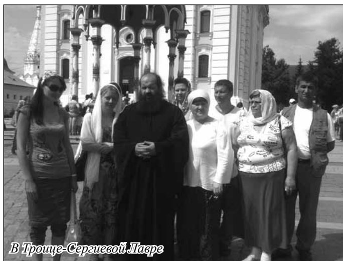
В Троице-Сергиевой Лавре