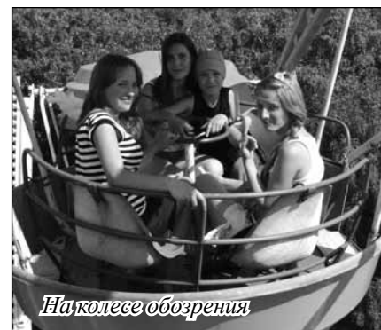
На колесе обозрения

Все мы, отправляясь в поход с кубиком, слабопредставляли себе, что это такое (мероприятия такого рода ещё не проводились). Собравшимся в трапезной участникам похода отец Вадим объяснил «правила игры». Обсуждаем варианты, направление и специфику маршрута, а игральный кубик выносит окончательно решение. В итоге кубик распорядился так: грузимся на яхты и идем из Оки в Москва-реку, вверх, против течения.