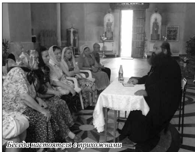
Беседа настоятеля с прихожанами