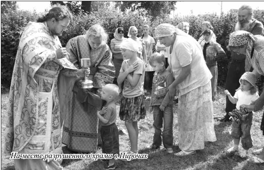
На месте разрушенного храма в Пирочах