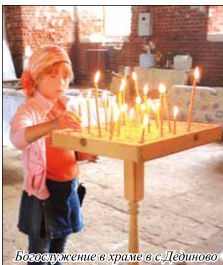
Богослужение в храме в с. Дединово

6 июля начался VIII Миссионерский поход. Семь дней Божественная литургия совершалась в разрушенных храмах Коломенского, Луховицкого и Озерского благочиний.