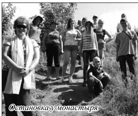
Остановка у монастыря