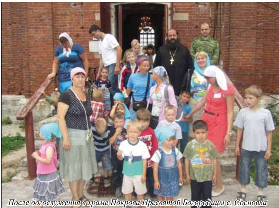
После богослужения в храме Покрова Пресвятой Богородицы с. Сосновка