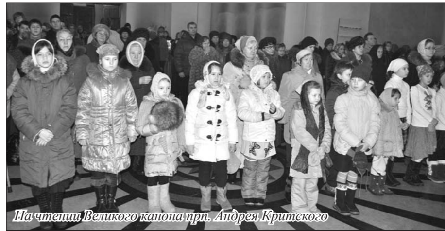
На чтении Великого канона прп. Андрея Критского