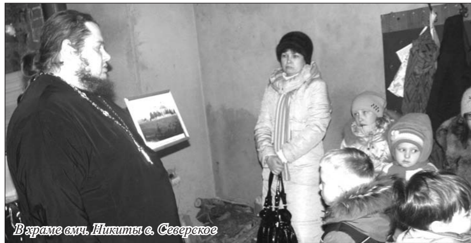
В храме свт. Никиты в с. Северское

Церковь в честь великомученика Никиты была воздвигнута в 1634 году, сначала была деревянной, спустя столетие возвели кирпичную в стиле «барокко». Храм до 1885 года оставался летним. На собранные прихожанами деньги построили два боковых придела в честь святителя Петра, Митрополита Московского, и мученицы Агафьи.