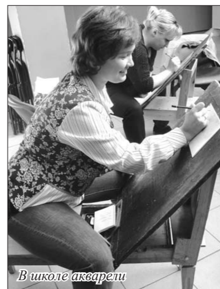
В школе акварели

Сотрудники, успешно сдав экзамены, поступили на первый курс обучения.