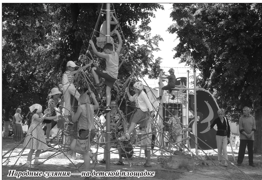
Народные гуляния — на детской площадке

Рядом детская игровая площадка, со множеством интересных лазалонок, прыгалок, ползалонок, качелей-каруселей. Малышня бесстрашно покоряет и укрощает глупое железо. А вот утеха всех сладкоежек – сладкая вата! Отойти два шага и вот тебе чай с пирожным. И дети, и взрослые не прочь отведают сладостей, кто-то не по одному разу. В толпе счастливых людей ходят такие-же счастливые медведи. Охотно фотографируются с желающими, стойко перенося жару под толстыми шкурами.