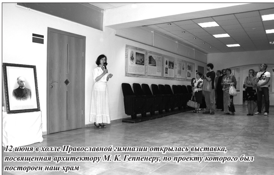
12 июня в холле Православной гимназии открылась выставка, посвященная архитектору М. К. Генпенеру, по проекту которого был построен наш храм

Солнце встало уже высоко, припекает, незаметно настает время повеселиться, тот самый «час потехи». Признаться, я не ожидал увидеть такое множество пришедших. Хотя, мое мнение о церковном веселии начало меняться уже с утра, но сейчас я в полной растерянности. Прихожане, гости, корреспонденты и, может быть, просто, мимо проходящие, выселяться и радуются от души. Это заметно, это чувствуется, здесь и сейчас такая энергетика. Все самое интересное (а здесь все самое интересное!) происходит одновременно.