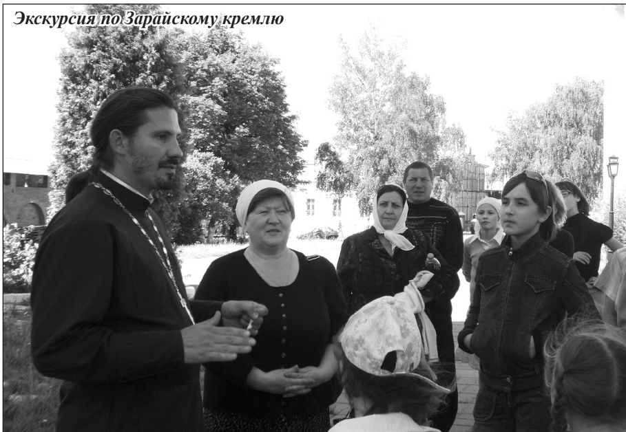
Экскурсия по Зарайскому кремлю

Уже под конец экскурсии в наших рядах взрослые начали перешептываться: «Это он!, «нет, и вправду он!». Отец Петр заметив оживление, представил нам гостей, которые стояли чуть поодаль от нас. Это были глава города Зарайска Олег Алексеевич Свинцов и знаменитый актер Владимир Алексеевич Конкин ,