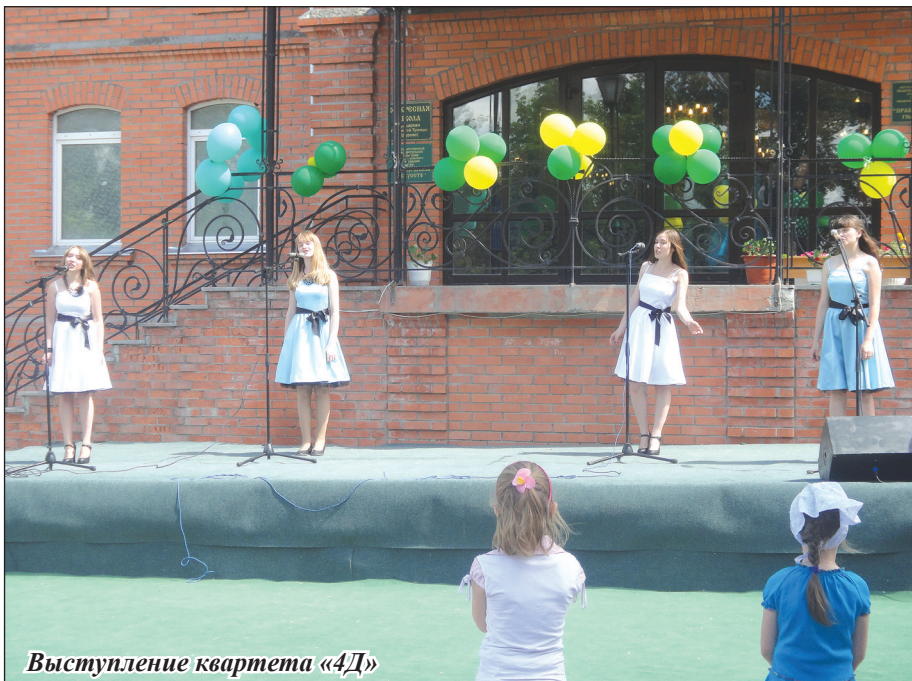
Выступление квартета «4Д»