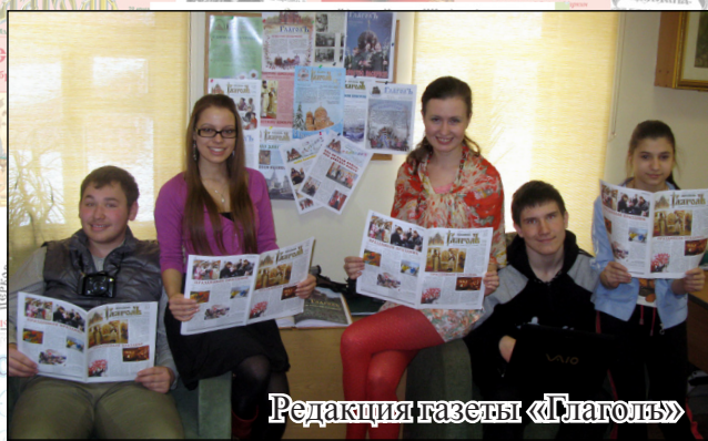
Редакция газеты «Глаголь»