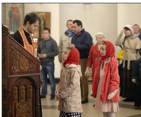
Дети на исповеди

Храм, и наш Троицкий – не исключение, это не только место молитвы, но и место общения, своего рода социальный центр. Прихожане – такие же люди, и тоже хочется обсуждать новости, делиться радостями и проблемами.