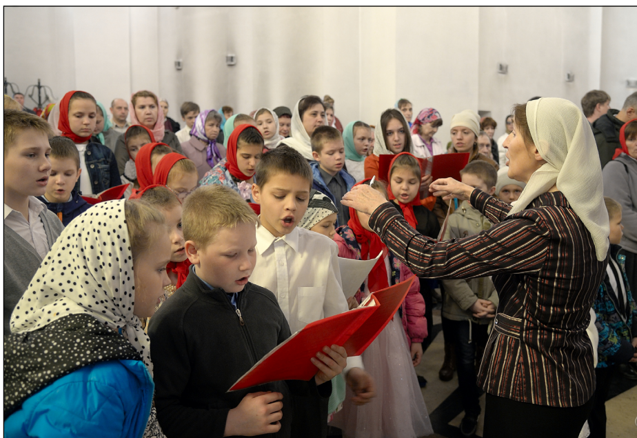
Хор воспитанников приюта

Какая судьба ждет наших подопечных после окончания гимназии, чем они будут заниматься и где жить? Однозначных ответов у нас пока нет – пока еще ни один воспитанник приюта не окончил Православную гимназию. Но совершенно точно, что и далее мы будем придерживаться принципа большой семьи: с выпуском из гимназии и совершеннолетием наше общение не закончится. Мы надеемся, что и в новой, взрослой жизни сможем оказывать помощь нашим подопечным. Каким образом – покажет время. Сейчас мы можем гарантировать лишь то, что ни один из детей не останется без поддержки и помощи, пока будет в ней нуждаться.