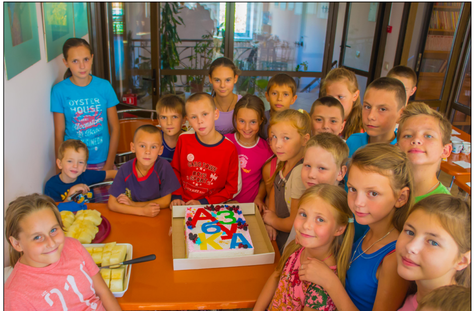
Наша дружная семья

И равнодушие, и любовь очень трудно замаскировать, тут дети – лучшие детекторы лжи. Очень хорошо, что с самого начала с детьми работали именно любящие, заботливые люди. И результаты не заставляли долго ждать, на контакт шли даже самые замкнутые дети.