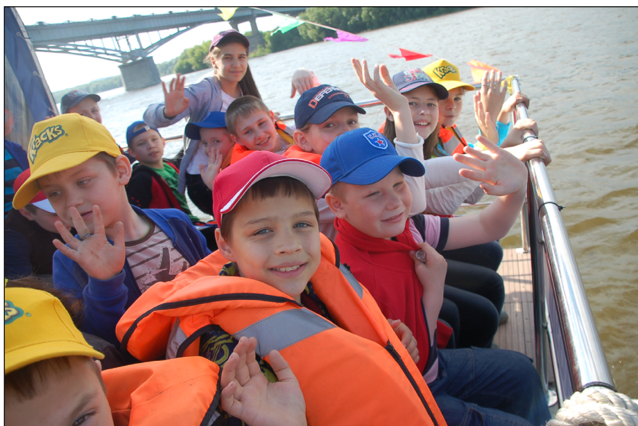
Прогулка на теплоходе

«Они такие разные, как вы с ними справляетесь?» – тоже вопрос из числа наиболее популярных у наших гостей. Ответ прост: семейную, теплую атмосферу не создать, не зная все о каждом воспитаннике. Как только новый подопечный поступает в приют, за ним закрепляется отдельный воспитатель чья задача – познакомиться с ребенком и узнать о нем буквально всё: его слабые и сильные стороны, привычки, характер – всё то, о чем должны знать настоящие родители. На основании этих данных для каждого ребенка пишется индивидуальный план. Если ребенок не бывал в музеях – задача воспитателя сводить его туда, если не умеет обслуживать