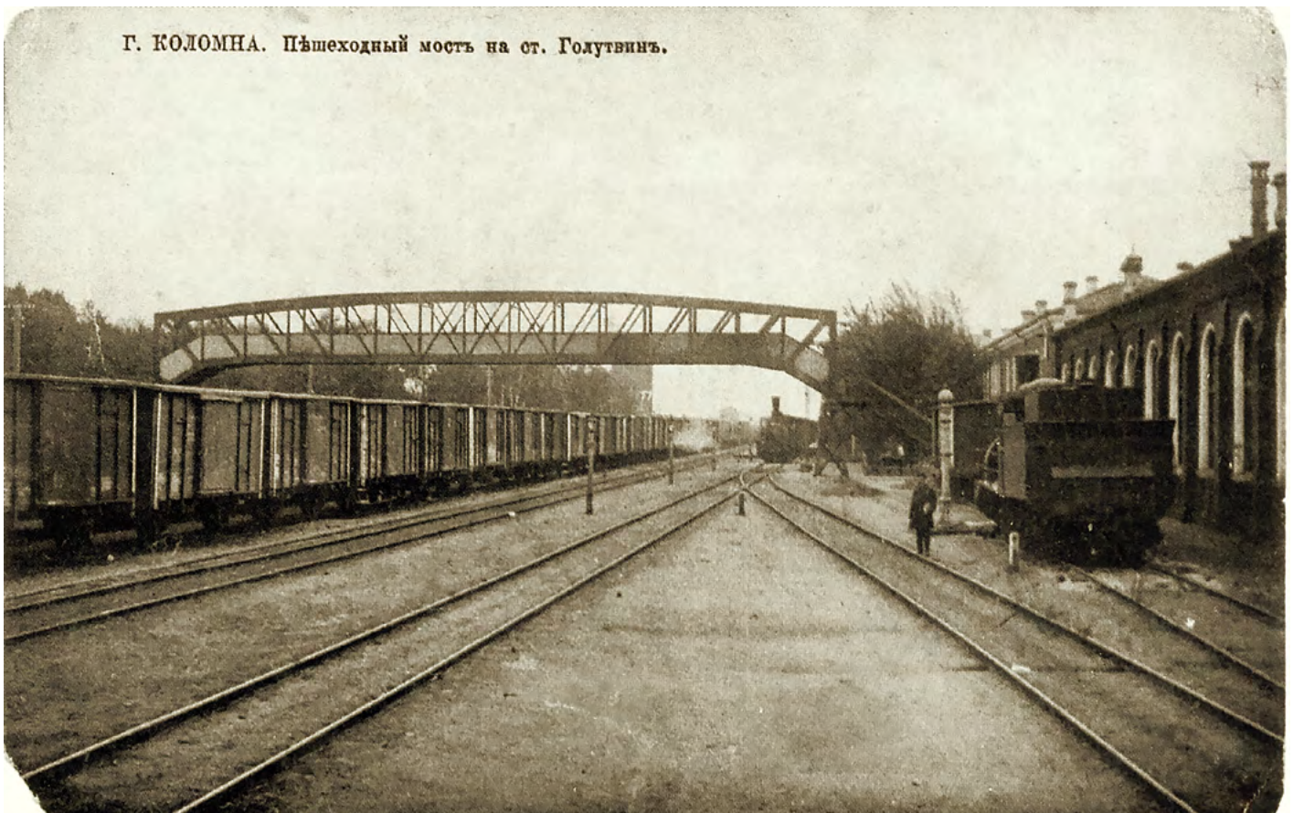
Г. КОЛОМНА. Пешеходный мостъ на ст. Голутвинъ.

Хоть не сразу, но постепенно дело стало налаживаться, и 11-го июня 1860-го года были начаты работы по строительству трассы, рельсы которой через два года дотянулись до Коломны, а жителям города объявили, что первый поезд прибудет 5-го июля 1862-го года.