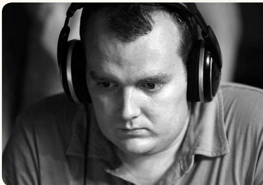
Режиссер Михаил Расходников

В кульминации фильма отец на руках относит Сашу в лес и бросает на произвол судьбы. Катарсис, всплеск эмоций - сцена встречи с медведем, хотя и наигранная, но это настоящее испытание сил и воли, бой один на один.