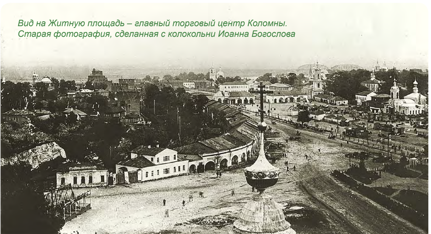
Вид на Житную площадь – главный торговый центр Коломны. Старая фотография, сделанная с колокольни Иоанна Богослова