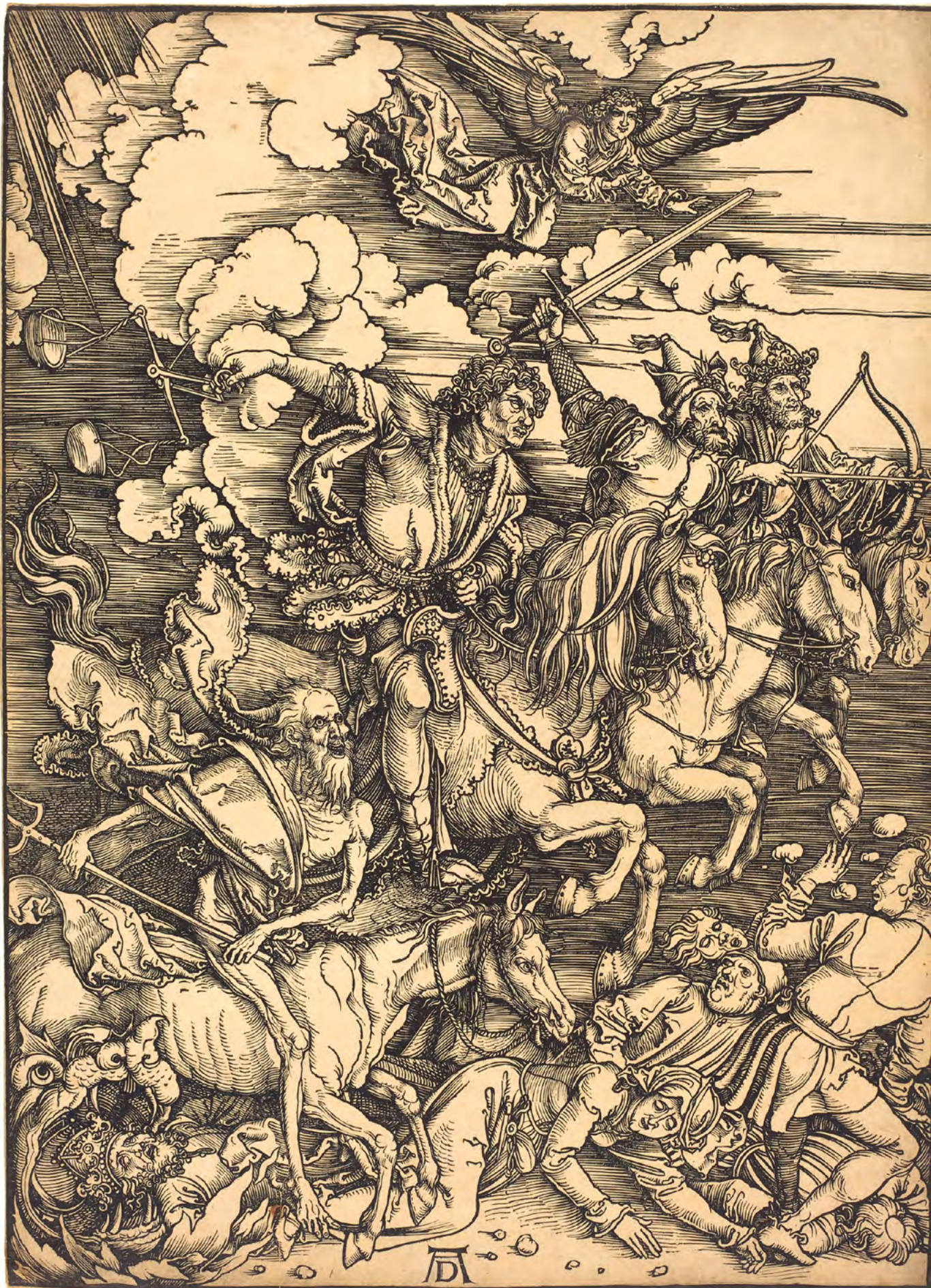
Альбрехт Дюрер. "Четыре всадника Апокалипсиса". Гравюра