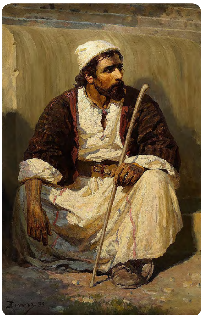
Христос и грешница. Ранний эскиз

Экспозиция картины в Зимнем Дворце после её покупки императором вызвала немало отзывов. Известно, что первоначальное расположение с неправильным освещением картине весьма вредило. Сам Поленов не раз выражал намерение дописать некоторые элементы, внести изменения. Однако, замыслы так и остались нереализованными и, придя в Русский музей, мы можем видеть картину точно такой же, какой её увидели зрители в день открытия выставки 25 февраля 1887 года.