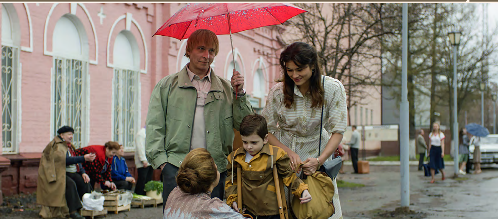
Кадры из фильма "Временные трудности"