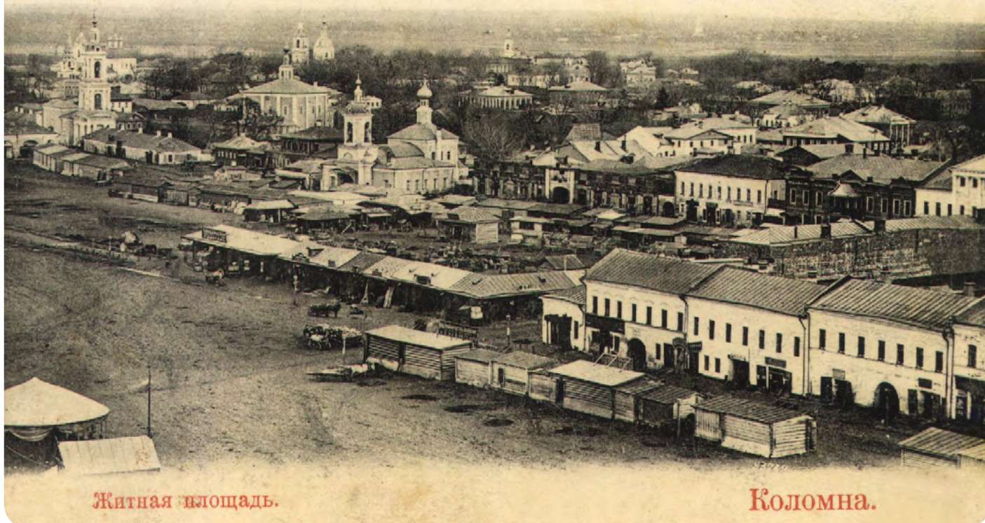
Коломна. Торговая площадь. Конец 19 века