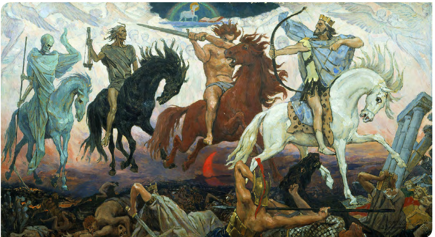
Виктор Михайлович Васнецов. "Воины Апокалипсиса" (1887). Холст, масло.