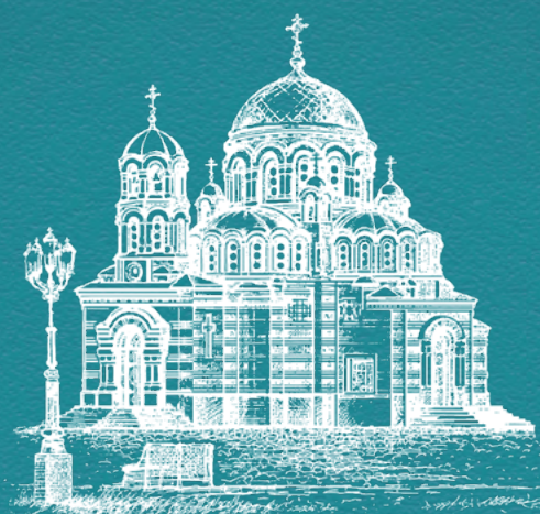
ХРАМ ПРЕСВЯТОЙ ТРОИЦЫ г. Коломна (Щурово)

ВОСКРЕСЕНЬЕ , ежемесячное издание. Учредитель - МРОПП Троицкого храма г. Коломны (Щурово) Московской обл. Московской епархии Русской Православной Церкви.