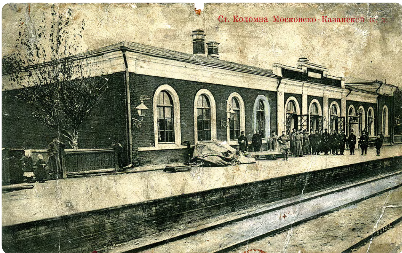
Ст. Коломна Московско-Казанской ж. д.