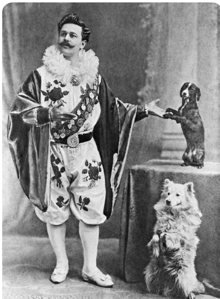
Дрессировщик Владимир Леонидович Дуров

В начале своей карьеры в Коломне на Житной площади выступал, ставший впоследствии знаменитым, дрессировщик Владимир Дуров, приезжавший в наш город с небольшим бродячим цирком, основанным итальянской семьей Безано.