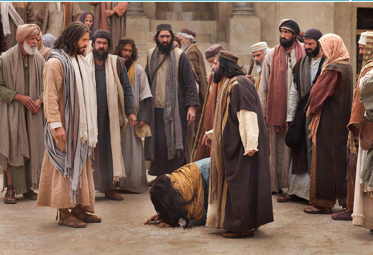
Кадр из фильма "Иисус"

Однако следует обратить внимание на одну деталь: Христос пишет на земле перстом. И это удивительно: ведь Христос никогда не записывал Своих проповедей, от Него не осталось ни единой записи. И этот случай, описанный евангелистом Иоанном – уникальный, второго такого нет во всем Четверокнижии. И вот, Христос пишет нечто на земле. Люди, видя это, бросают камни на землю и в стыде уходят. По мнению некоторых толкователей (а это именно частное мнение, а не догма), Христос писал пальцем на земле грехи каждого из обличителей. Он не говорил вслух, но записываемое было видно тем, кто стоял перед Ним. По закону, первым бросить камень должен был свидетель преступления. Но, взглянув, как Иисус написал нечто, уличающее его самого, свидетель поспешил покинуть площадь, где он сам легко мог быть превращен из обвинителя в жертву. И то же происходило со всеми последующими. Спрашивая «-Кто без греха?», Христос не ждал лицемерного признания безгрешности. Ведь сегодня любой исповедующий священник наверняка может вспомнить прихожан, как на духу заявляющих, что грехов за собою не знают. Христос не обвинял никого явно, но показывал обличителям, в чем их грехи – действенное вразумление оказалось эффективным. Конечно, каяться прилюдно не стал никто – слишком велика была бы мера позора. Но сам факт, что люди разошлись, красноречиво говорит, что им было, что скрывать.